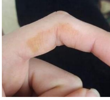
Res. 1 3.Kaynak Kişiyeye ait izler

Aslında bu kına benzeri izler bir tür mantar enfeksiyonu (Res.1), tıpta adı Tinea Nigra 'dır (URL 1). Tinea kelimesi mantar enfeksiyonu ve nigra ise siyah anlamındadır. Bu enfeksiyona neden olan mantar türü çoğunlukla çürüyen odun, toprak veya kanalizasyonda bulunur. Deri lekelerinin ortaya çıkması bir ila iki ay sürebilir. Durum herkesi etkileyebilir ancak yapılan araştırmalar sonucunda 20 yaş altındaki kadınlarda bu durumun daha sık görüldüğü tıbbi olarak bildirilmiştir. Bu nedenle halk arasında “evlenme yaşına gelmiş kızları işaretlerler” gibi bir söyleme neden olmuştur. Bu hastalığın bu ilginç özelliği ve kına renkli lekeleri genç kızların evlenme çağına geldiğine bir işaret olarak sayılması son derece mantıklı bir bağdaştırmadır. Hastalığın tedavisi son derece basittir, topikal kremler ile kolaylıkla geçmektedir. Ancak halk inançları içinde yerleşmiş bir inanç kişilerin daha çok hocaya gitmelerine neden olmaktadır. Basit bir deri hastalığı ile genç kızların kendini evlenmek zorunda hissetmeleri, üzerlerinde oluşan baskı, psikolojik olarak kuşkusuz çok daha derin izler bırakmış olmalıdır.