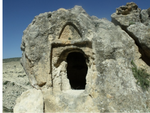
Resim 15- Gödet (Güldere), Kabaklık denilen mevkiye ana kayaya açılmış kaya mezarı.

Kabaklık adı verilen yerdeki küçük ana kayanın batı cephesine bir kaya mezarı açılmıştır (Resim 15). Mezarın girişi, 1.00x1.65 m ölçülerinde sığ bir dikdörtgen niş içerisine yerleştirilmiştir. Giriş açıklığının üstünde 0.70x0.90 m ölçülerinde yine sığ bir mihrap niş yer almaktadır. Kaya mezarı, bu şekilde üçgen alınlıklı örneklerini hatırlatmaktadır