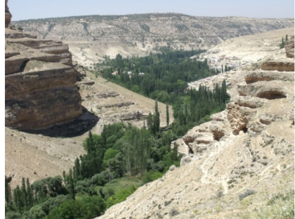
Resim 5- Gödet (Güldere) Köyü.