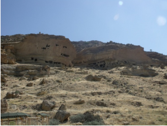
Resim 16- Manazan kaya yerleşmeleri sahası, genel görünüm.