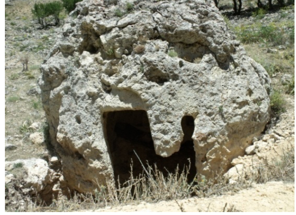
Resim 11- Gödet (Güldere), Tekneli mevkinde bulunan şapel, genel görünüm.