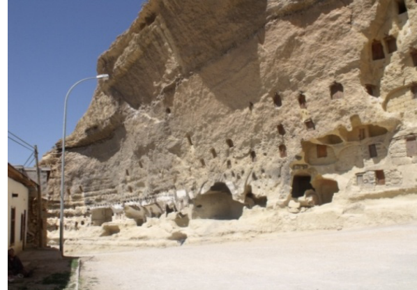
Resim 18- Taşkale, tahıl ambarları.