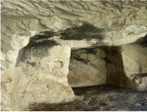
Resim 14- Gödet (Güldere), Kabaklık mevkesinde yer alan kaya kilisesi, detay.

mağaranın iki yanında 2-3 kat halinde küçük mağaralar uzanmaktadır. Kaya yerleşmelerinin içerisinde tahıl ambarları, kaya mezarları ve birbirlerine dehlizlerle bağlı meskenler vardır (Belke-Restle 1984: 169-170). Kaya yerleşmesinin önünde zaman içerisinde meydana gelen kopmalar nedeniyle, mekânların bazılarında ön taraf moloz taş örgülü duvarlarla kapatılmıştır.