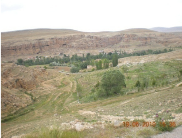
Resim 3- Divle (Üçarman), Obruk Tepesi'nden köyün ve kaya yerleşmeleri sahasının genel görünümü.