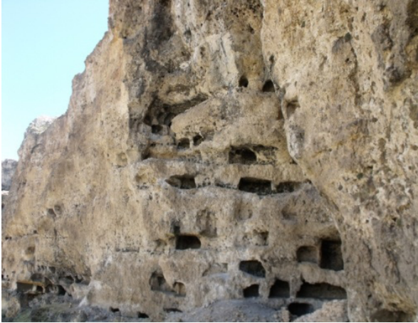
Resim 13- Gödet (Güldere), Yabangülü kaya yerleşmeleri sahası, kaya oygular (detay).