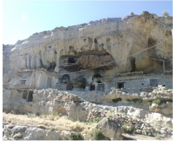
Resim 6- Gödet (Güldere) Köyü'nün girişinde Hıristiyanlık Dönemi kaya yerleşmeleri sahası.

Vadi içerisinde doğu-batı yönünde uzanan Divle yerleşiminin hemen kuzeyinde ve Koca Deresi'nin akışına göre sağında kat kat yükseltilerden oluşan kaya kiliseleri ve yerleşmeleri vardır (Resim 3). Taşkale Kasabası'ndaki Manazan yerleşmesiyle büyük benzerlikler gösteren Divle kaya yerleşmeleri de çevresindeki diğer benzerlerinde olduğu gibi halk tarafından "kale" olarak adlandırılmaktadır. Çok sayıda irili ufaklı yapı arasında odalar, mahzenler, harçlı yapılar ve sarnıçlar görülmektedir (Konyalı 1970: 839; İncekara 1993: 14).