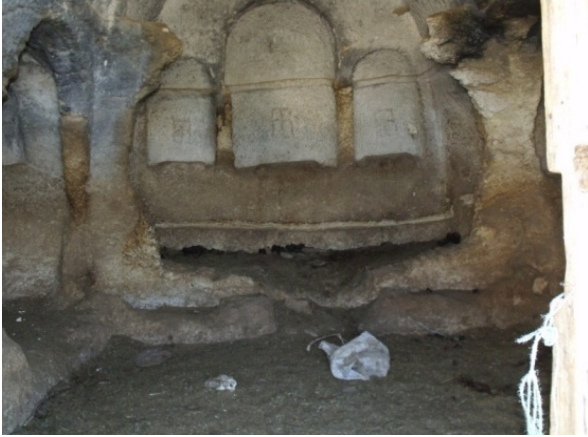
Resim 8- Gödet (Güldere), Söğütçük kaya kilisesi girişinin karşısındaki mihrap niş.