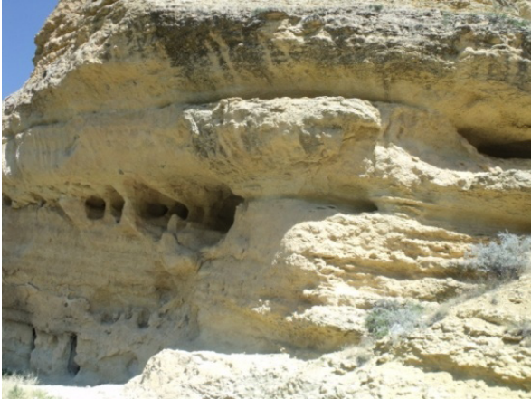
Resim 17- Manazan kaya yerleşmelerinin doğusunda, Taşkale yolu üzerindeki mağaralar grubu.

Mağaranın ön cephesi doğal olaylar sonucu tahrip olduğundan belirgin bir girişi yoktur. Birinci katta oyuklar şeklinde birçok mezar odası vardır. Bu katta, doğudan batıya doğru sıralanan odalardan bazılarının ise şapel olduğu anlaşılmıştır. Giriş katının doğusunda bir niş içerisindeki arcosolium (mezar odası) yazıtlı olması nedeniyle dikkat çekicidir. Bir bölümü tahrip olan yazıtta şu ifadeler yer almaktadır: