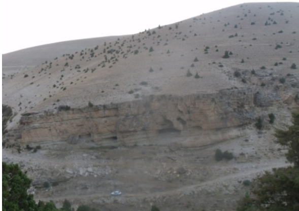
Resim 19- Çatköy, Uludere mevkinde yer alan kaya yerleşmeleri sahası, genel görünüm.