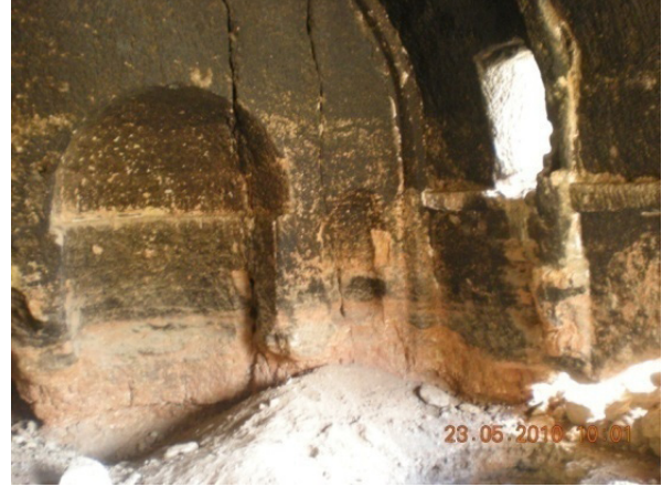
Resim 2- Buğdaylı kaya kilisesi, detay.

parçalarından Roma-Bizans dönemi yerleşmesi olduğu anlaşılmaktadır. Küçük bir derenin her iki yamacına yayılmış olan yerleşimin eteklerinde yapı izleri ve mimarî parça kalıntıları da gözlemlenmektedir.