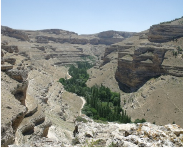
Resim 9- Gödet (Güldere) Vadisi'nin genel görünümü.