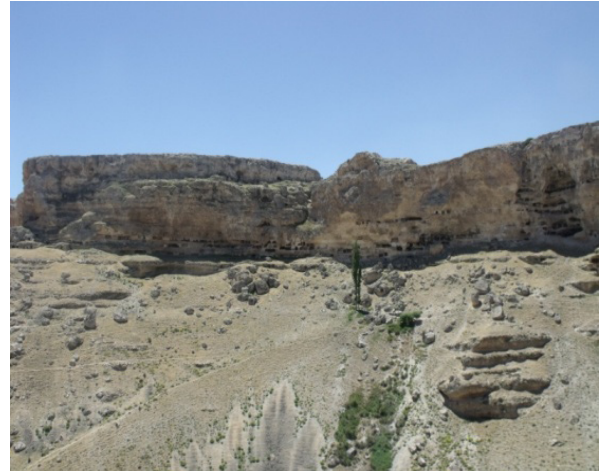
Resim 12- Gödet (Güldere), Yabangülü kaya yerleşmeleri sahası, genel görünüm.