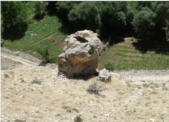
Resim 10- Gödet (Güldere), Tekneli mevkiinde oyu tekne mezar.

Köyün hemen kuzeyinde Söğütçük adı verilen mevkide küçük bir kaya kilisesi yer almaktadır. Kaya kilisesinin giriş kapısı mihrap nişle bezenmiştir (Resim 7-8). Belki de köye yakın olması sebebiyle çok fazla tahribata uğramamıştır. Aynı mevkide kaya kilisesinin yer aldığı kayalığın uç kısmına doğru bir oyu tekne mezar da bulunmaktadır.