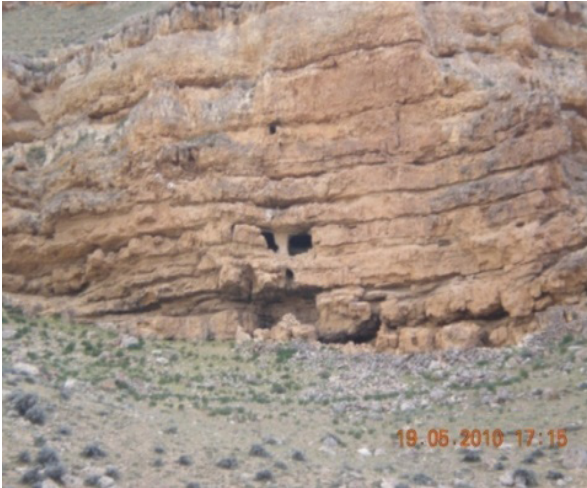
Resim 4- Divle (Üçarman), Başlamışlı Vadisi kaya yerleşmeleri sahasından görünüm.