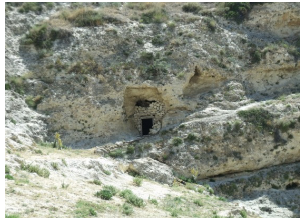
Resim 7- Gödet (Güldere), Söğütçük mevkinde kaya kilisesi.

5. Tarihi "Mara yolu", Gödet (Güldere) Köyü sınırları içerisinde geçmektedir.