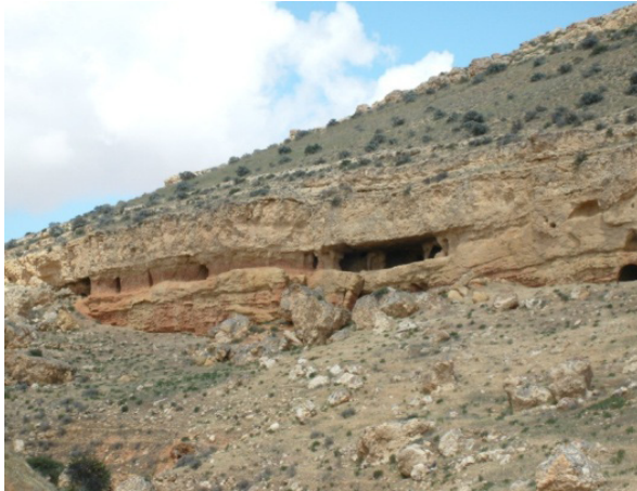
Resim 1- Buğdaylı kaya yerleşmeleri sahasından görünümlü.

Karaman'ın 65 km doğusunda, Ayrancı İlçesi'nin ise 15 km güneyinde yer almaktadır. Köyün içerisinde Küçük Koraş Köyü'nden gelen Buğdaylı Çayı geçer. Buğdaylı Köyü'nün kuzeyinde ve Divle (Üçharman) Köyü'nün batısındaki kayalıklara açılan kaya kiliseleri ve kaya yerleşimleri sahası (Resim 1-2), köylüler tarafından "kale" olarak adlandırılmaktadır (Konyalı 1970: 836). Buğdaylı Çiftliği'nin içerisinde yer alan yerleşimin eteklerinde görülen seramik