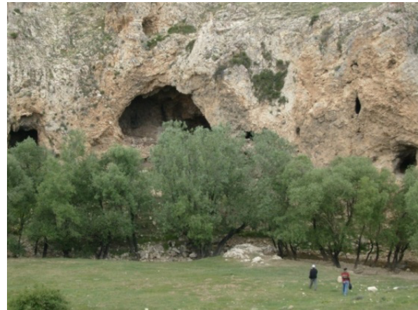
Resim 20- Divaz (Pınarkaya), Mazıtlı kaya yerleşimi sahasının genel görünümü.